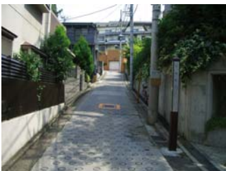
⑤ 坂の上り口に「久七坂」の碑が見えたら、急な坂を道なりに進む。⇒