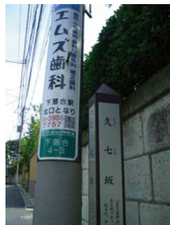
⑥ 再度「久七坂」の碑が見えたら、ベージュのお邸の手前を右に曲がる。⇒