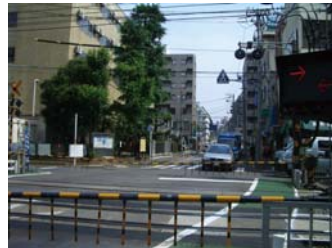
② 改札を出たら右側にある踏切を渡り、直進。⇒ ※ 車道の右側(駅側)通行して下さい。