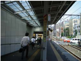
① 西武新宿線「下落合」駅南口から改札を出る。⇒ ※ 新宿・高田馬場から乗車する場合、進行方向1両目に乗車して下さい。