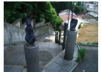
⑧ 下りの階段が見えたら、右に進み、3軒目が事務所です。