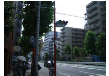
④ 新目白通り沿いに進み、一つ目の信号を左に曲がる。⇒