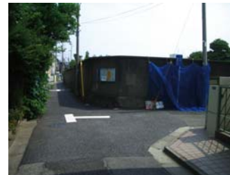
⑦ 突当りを道なりに左へ進み、すぐ右へ曲がる。⇒