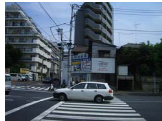
③ 妙正寺川の橋を渡り、一つ目の信号を渡り切ったら右に曲がる。⇒